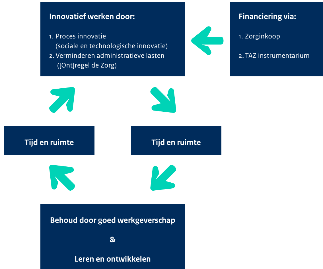
Figuur iteratief proces anders werken